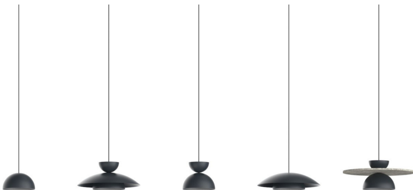
Tires Model 1 31310-